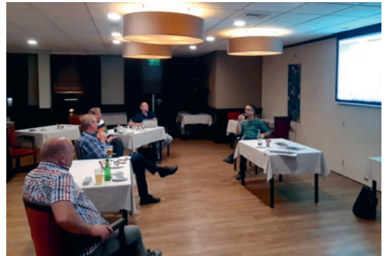
Presentatie schetsontwerp aan Klankbordgroep.

Op 8 oktober jl. presenteerden we het eerste ontwerp aan de Klankbordgroep. Daarop kwam een