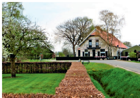
Het Goirle, gebouwd in 1912. (foto: Oudheidkundige Kring Voorst)

Uitgave van Waterschap Vallei en Veluwe , Steenbokstraat 10 | 7324 AX Apeldoorn | Telefoon 055 - 5 272 911 E-mail waterschap@vallei-veluwe.nl | Internet www.vallei-veluwe.nl | Vormgeving team communicatie Foto's Waterschap Vallei en Veluwe | December 2020 Aan informatie in deze nieuwsbrief kunnen geen rechten worden ontleend.