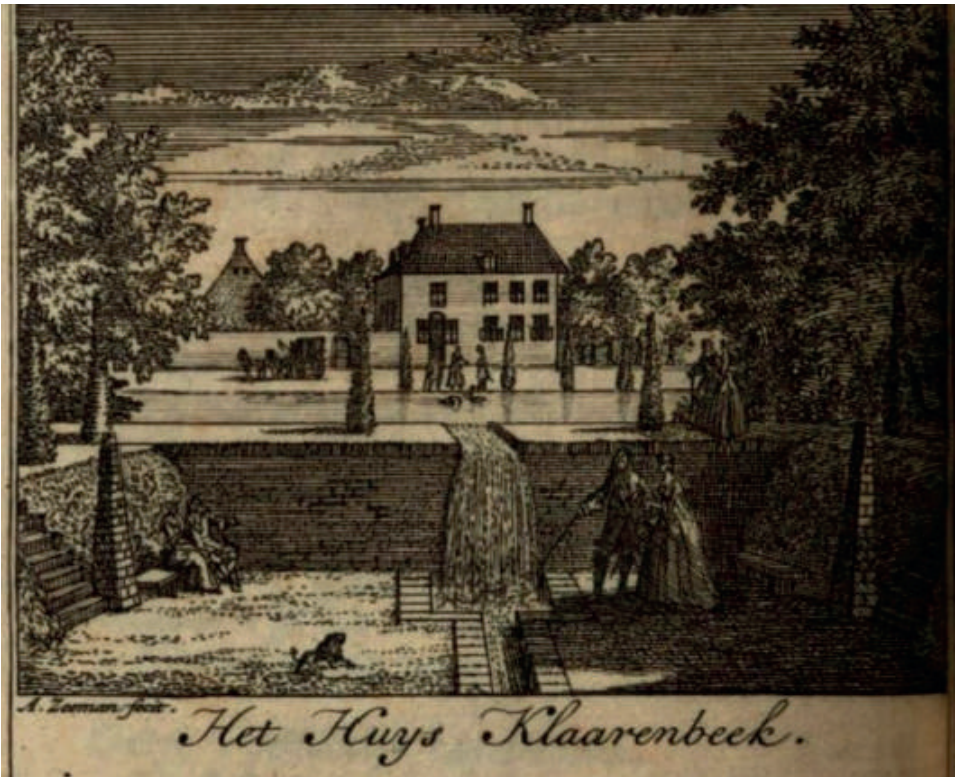
Het Huis Klaarenbeek in Arnhem

De tweede particulier was Willem Huijgens, een Amsterdamse notabele die optrad namens zijn vader Theodorus Huijgens, Heer van Opvoorst. Pluijm beloofde