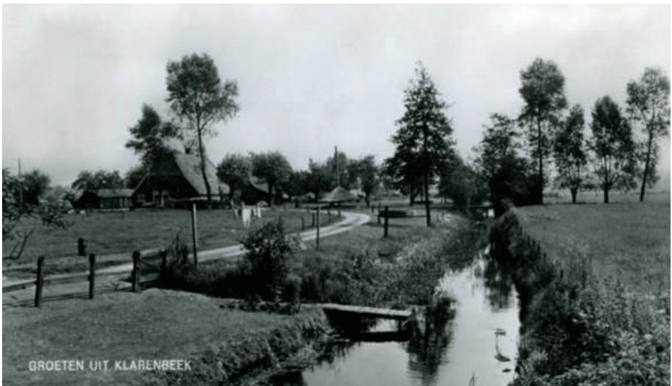
Ansichtkaart met de Klarenbeek gezien vanaf de Kopermolenweg. De naam Klarenbeek voor de beek wordt voor het eerst vermeld op de kadastrale kaart van 1832. Het huis links, waar nu de veearts woont, bestond in 1732 nog niet.

Vervolgens zien we de naam Klarenbeek geleidelijk in verschillende documenten verschijnen. In het begin misschien als aanduiding voor de kopermolen, maar later vermoedelijk als naam voor de directe omgeving ervan en als naam voor de beek