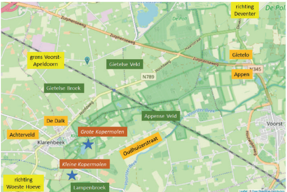
Het huidige Klarenbeek en omgeving (kaart: OpenStreetMap)

gebied. De kerken en de scholen waren er niet, wel twee kopermolens. Die bestonden sinds 1732. Aan de Voorster kant van de grens heette het gebied toentertijd het Appense en Gietelse Veld. Dat strekte zich vanuit de gehuchten Appen en Gietelo naar het westen uit. Geleidelijk ging dat vervolgens over in het Appense en Gietelse Broek en verder naar het zuidwesten in het Lampenbroek. Aan de Apeldoornse kant heette het gebied het Achterveld, het achterveld van Oosterhuizen.