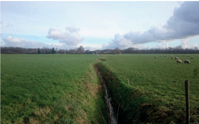
De oude benedenloop van de Beekbergse beek in het Lampenbroek in 2015, nu de Verloren beek. De kopermolen stond in de verte rechts naast de schuren.

Voor hij mocht beginnen met het bouwen van de molen moest hij eerst een winter