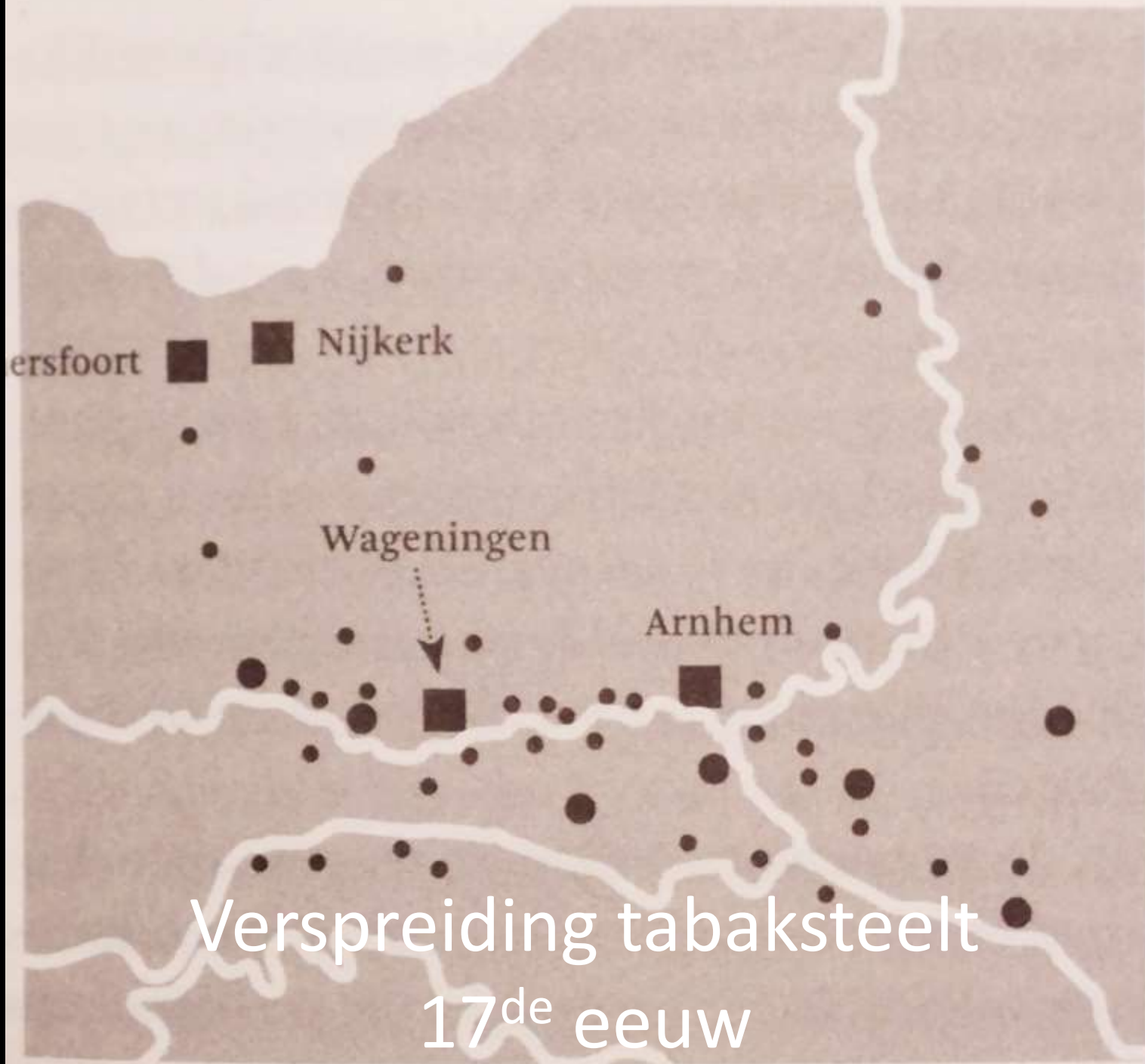
Verspreiding tabaksteelt 17 de eeuw