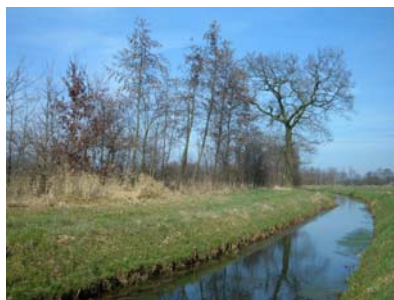
Stougraaf, even ten zuiden van de kruising met de Oude Zutphenseweg (2003)

Het wandelpad volgt ook de historische route die Landdrost Torck in 1750 aflegde tijdens de opmeting van de grenzen van de heerlijkheid Het Loo.