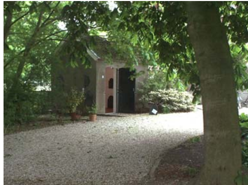
Haardplatenmuseum Klarenbeek, direct aan de route

Zo laat een wat langere dag zich prima beginnen op het dorp Klarenbeek. Kop koffie bij Restaurant Pijnappel, nog een paar kleine inkopen en dan onderweg.