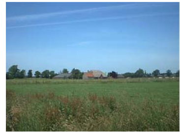
De Bloemenk, ongeveer 1750

Sloten, ruigten en verten wisselen elkaar af. We passeren kleine landschapselementen, kikkerpoelen, en oude elzenbosjes. Het landschap is zoals het zich aandient. Een boer komt op z'n tractor voorbij. We zitten langs de waterkant, meegebrachte boterham in de hand.